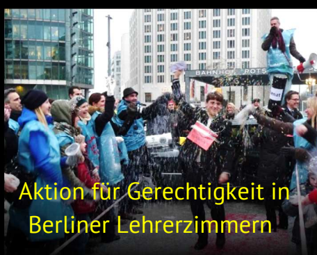
Aktion für Gerechtigkeit in Berliner Lehrerzimmern

Infos im Netz: bildet-berlin.de facebook.com/bildetberlin/ twitter.com/BildetBerlin