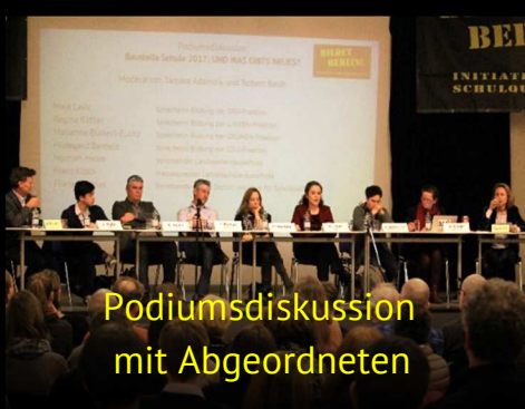
Podiumsdiskussion mit Abgeordneten